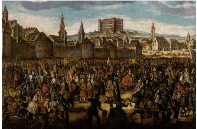
Ilustračný obrázok – Korunovácia Márie Terézie v roku 1741

Pozorne si prečítajte text opisujúci priebeh korunovácií a v Google Maps ho pomocou nástroja “Vaše miesta” vyznačte do mapy. Do mapy môžete okrem trasy vyznačiť (bodovo) aj jednotlivé zastavenia. Pri tvorbe mapy je nutné prihlásenie do konta Google (napr. cez Gmail). V prípade, že trasu korunovačného sprievodu nedokážete do mapy vyznačiť, sledujte ju aspoň “prstom na mape”. Začnite od Dómu sv. Martina.