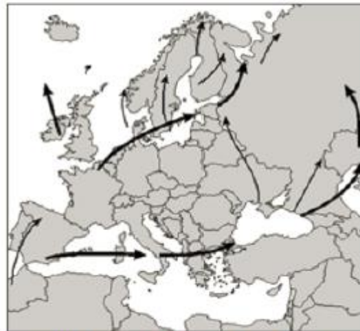
Mapa 2: Migračné trasy smerom na sever počas jari

Ktoré tvrdenia vyplývajú z vyššie zobrazených máp? (jedna alebo viac možností):