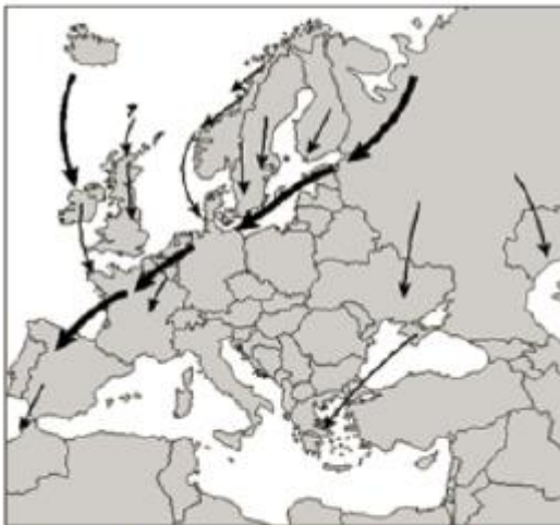
Mapa 1: Migračné trasy smerom na juh počas jesene